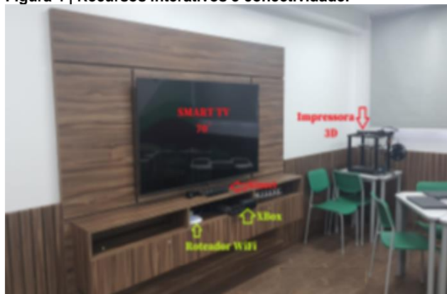
Figura 4 | Recursos interativos e conectividade.

Conforme apresentado na tabela 1, foram realizadas a reforma do ambiente físico (pintura e piso), a instalação da rede elétrica, instalação da infraestrutura de comunicação de dados (switch, roteadores WiFi e cabeamento estruturado) e material para instalação de redário, também foram adquiridos e instalados no espaço: Smart TV de 70", Xbox com Kinect, , impressora 3D (figura 4), Notebooks de última geração, óculos de realidade virtual e smartphone com giroscópio (figura 5) e sofá (figura 6).