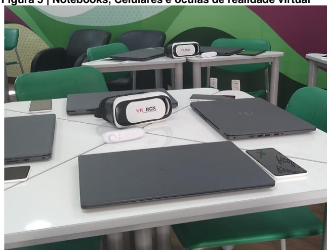
Figura 5 | Notebooks, Celulares e óculos de realidade virtual