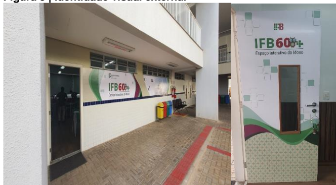
Figura 3 | Identidade visual externa.