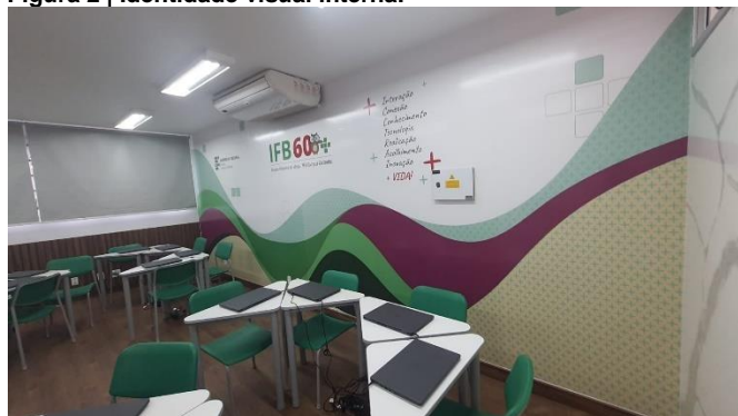
Figura 2 | Identidade visual interna.

Para criação da identidade do espaço, contamos com o apoio do design gráfico da Direção de Comunicação do IFB. A identidade visual trouxe as cores do próprio espaço, além da logo do grupo de Inclusão Digital e Social para pessoas idosas do IFB (IF60+), no centro, as palavras representam a interatividade (figura 2 e 3).