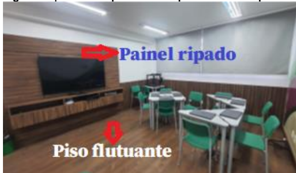
Figura 1 | Painel Ripado com ripas laterais e piso flutuante