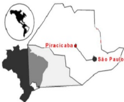
Figura 1: Localização do Município de Piracicaba, SP

A área de estudo deste projeto teve o enfoque na cidade média, como exemplo a cidade de Piracicaba, SP. O município de Piracicaba (SP), situado a 138 km de distância, em linha reta, de São Paulo, SP (Figura 1) a uma altitude de 540 m está localizado nas coordenadas geográficas de 22°42' de latitude sul e 47°38' de longitude oeste de Greenwich (Silva Filho, 2004).