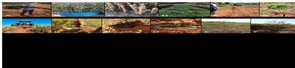
Figura 1. Etapas do plantio das mudas de E. urograndis para implantação de Sistema Silvipastoril intensivo na Fazenda Itapuã. A – Trator fazendo os sulcos nas linhas pré-demarcadas. B – Imagem demonstrando o nivelando do sulco nos locais de plantio das mudas. C – Aplicação de 500 ml de hidro gel nas covas feitas utilizando cavadeira. D – Adubação de cobertura no plantio, utilizando 220 g da formulação 4-30-10. E – Imagem demonstrando as linhas dessecadas após aplicação de herbicida. F – Muda estabelecida e com bom desenvolvimento cerca de 5 meses após o plantio (abril/2020).

A implantação das árvores começou em agosto de 2019, seguindo as diretrizes de GUERREIRO et al. (2013). A área foi preparada previamente para o plantio, incluindo o controle de formigas cortadeiras, demarcação e sulcamento das linhas com equipamento adequado (Fig. 1, A). As mudas foram plantadas manualmente em berços nivelados e com hidrogel já aplicado, seguido de adubação de cobertura e distribuição de iscas formicidas ao longo das linhas (Fig. 1, B, C, D, E). O controle da braquiária foi feito com herbicida (glifosato) (Fig. 1, E, F). Houve replantios em dezembro de 2019 e janeiro de 2021, além de substituições pontuais de plantas perdidas.