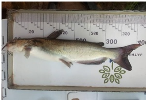
Figura 2: Exemplar de Ictalurus punctatus capturado em janeiro de 2020, com 350mm de comprimento padrão.

Os proprietários com tanques de piscicultura confirmaram a perda de todos os seus peixes pois o nível mais alto da inundação superou a altura dos tanques em relação à média da coluna d'água do riacho Pouso Alegre.