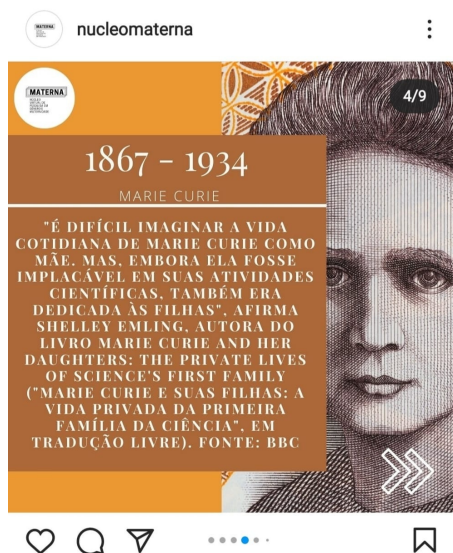
Figura 1 - Postagem 18 de abril de 2021 do Núcleo Virtual de Pesquisa em Gênero e Maternidade

Frederici (2019) afirma que o trabalho doméstico historicamente atribuído às mulheres é parte de uma engrenagem de opressão que dissemina a submissão feminina e o trabalho do cuidado não remunerado, o que provoca dissensos em relação a divisão de tarefas domésticas e vai ao encontro da descaracterização dos trabalhos que se voltam para o cuidado como de professoras da educação infantil, do ensino fundamental e do médio que, na sua maioria, estudam em cursos de humanas.