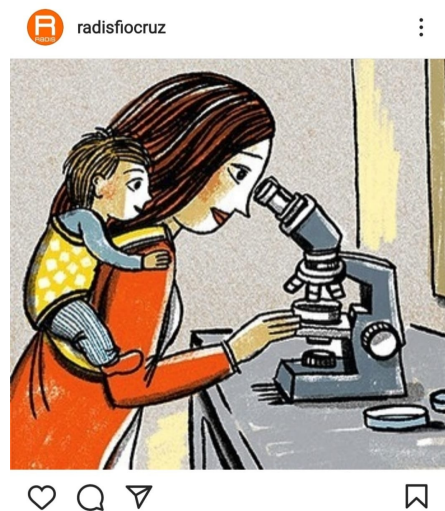
Figura 2 - Postagem 28 de janeiro de 2021 do programa RADIS de Comunicação e Saúde Fiocruz

carrossel de imagens nas postagens nas redes sociais), a que selecionamos para nossa reflexão, traz ao fundo o rosto sério da cientista e mãe Marie-Curie que não só foi a primeira ganhadora do Prêmio Nobel como conseguiu repetir o feito em razão da descoberta da radioatividade, o discurso verbal colocado a frente de seu rosto traz um quadro com a data de nascimento e morte "1867 - 1934" seguido de: "É difícil imaginar a vida cotidiana de Marie Curie como mãe. Mas, embora ela fosse implacável em suas atividades científicas, também era dedicada às filhas (...)", há, portanto, a produção de efeito de sentido pelo uso do conectivo "embora" que, numa primeira leitura, entendemos como uma mulher que era excelente no seu trabalho conseguia também cuidar das filhas, outra possibilidade interpretativa é a de que mesmo sendo cientista, ela também conseguiu cuidar das filhas. Ademais, a questão central aqui é o fato da postagem trazer Marie-Curie, mulher, mãe e cientista do campo das ciências exatas. Diante do que nos trouxeram os algoritmos, essa postagem, tal como outras, traz a imagem de uma cientista de importância singular para os estudos sobre radioatividade, há um suposto apagamento da imagem das cientistas em outras áreas como aquelas que também teriam grandes feitos.