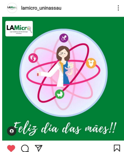
Figura 5 - Postagem do dia 9 de maio de 2021, pela Liga Acadêmica de Microbiologia da UNINASSAU

A figura 3 traz elementos imagéticos diversos, junto com os enunciados "Ciência, maternidade e pandemia - a realidade de três cientistas mães em meio a Covid-19" acompanhada de três imagens, uma delas está em vermelho, entendemos ser a representação de um vírus ou bactéria, a outra é uma mulher segurando um bebê e a terceira trata-se de uma mulher olhando em um microscópio. Logo, podemos afirmar que os implícitos são dados a ver quando colocados numa série, o que significaria dizer que ao mostrar a regularidade dos elementos que se referem a área como exatas, biológicas ou ainda as STEMs, notamos que a o sentido caminha para sedimentar o estereótipo da cientista enquanto aquela que usa jaleco ou faz uso de um microscópio.