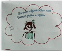
Figura 6 – Aluno D