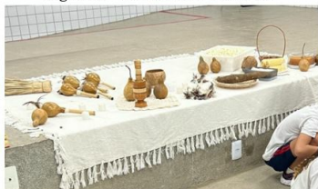
Figura 1 – Instrumentos da cultura

Passo 1: A Motivação - Nessa etapa, iniciamos com uma provocação para os alunos, apresentando algumas imagens que fazem referência aos povos originários, colocamos à disposição: maracá, cocar, colar indígena, cabaça, pilão indígena, vassoura de palha. Ainda na motivação, os alunos usaram Chromebooks para pesquisar sobre a cultura indígena e os elementos utilizados por esses povos.