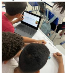
Figura 2 – Pesquisa na internet