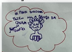
Figura 3 – Aluno A

Em seguida, pedimos aos alunos que registrassem as suas impressões sobre os povos indígenas em uma cartolina, a qual será utilizada posteriormente no momento da interpretação. Pedimos que falassem com suas palavras quem eram os povos indígenas para eles e também que falassem da sua relação com esses povos.