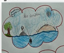
Figura 4 – Aluno B