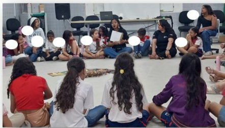
Figura 7 – Apresentação da obra